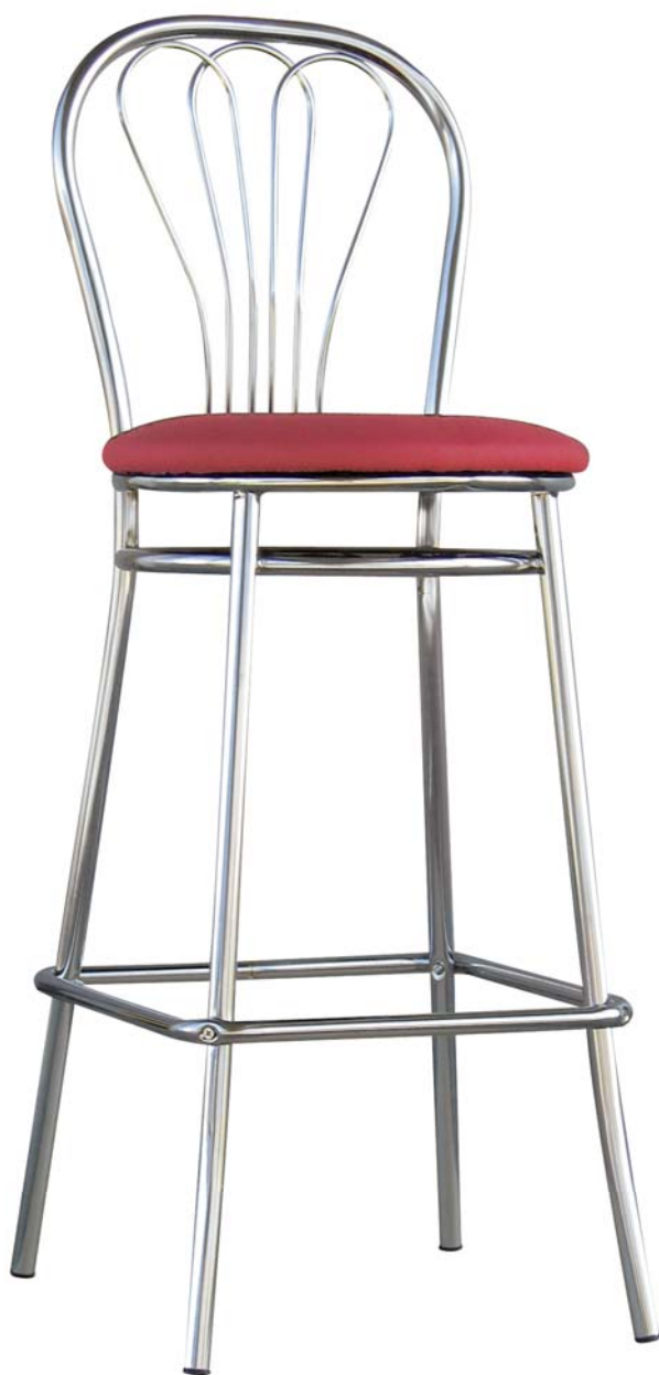
Venus Hoker Chrome