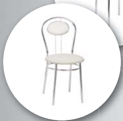
..... Cappuccino 165